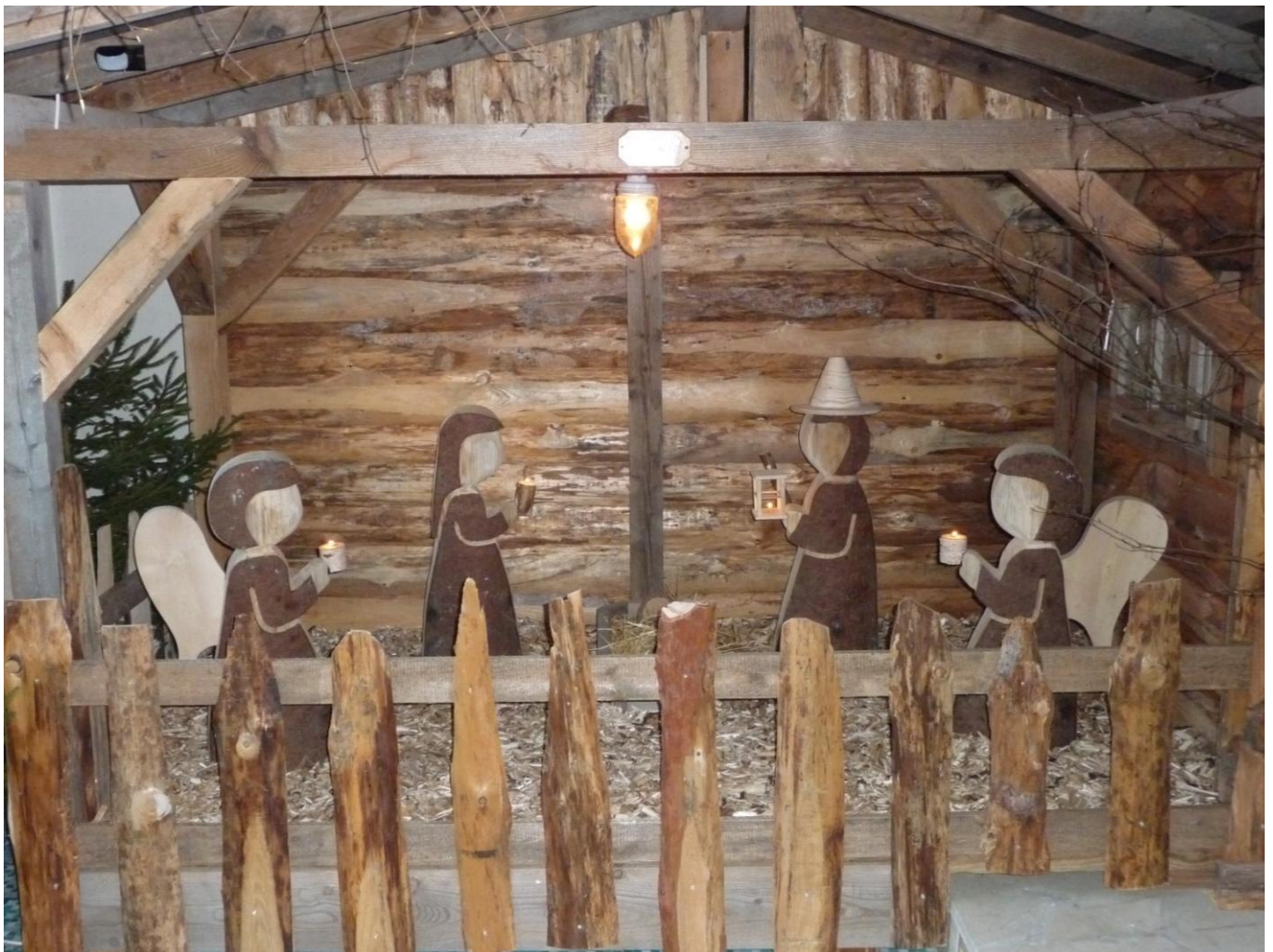
Weihnachtskrippe in Neubau